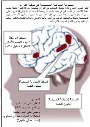
دماغ طفل عادي

كما ينبغي علينا أن نميِّز بين (الضعف القرائي) والدسلكسيا "صعوبات القراءة المحددة"، فالضعف القرائي يحدث نتيجة عوامل كثيرة مثل: تدني القدرات العقلية للطفل، أو ضعف قدراته السمعية والبصرية، أو مستوى التدريس غير المناسب، أو أي ظروف بيتية أو مدرسية غير مناسبة، أما